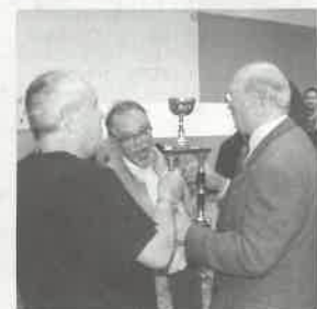
Prix du public décerné à l'IME La Feuilleraie.

LA 20 e ÉDITION DU SALON D'ART ENFANTIN qui s'est tenu du 10 au 13 mai à l'Espace Jean-Carmet a vu la participation de 17 structures (écoles, accueils de loisirs...). « Cet événement a fédéré plus de 700 visiteurs sur l'ensemble de la semaine. Les classes des écoles maternelles et élémentaires ainsi que de nombreuses familles ont pu apprécier la qualité du travail présenté. Depuis la 1 re édition, en mai 1996, on voit des choses formidables », s'est