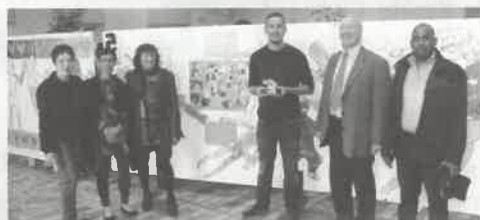
Les élus entourant le chef de projet du multi-accueil Serge-Levrez.